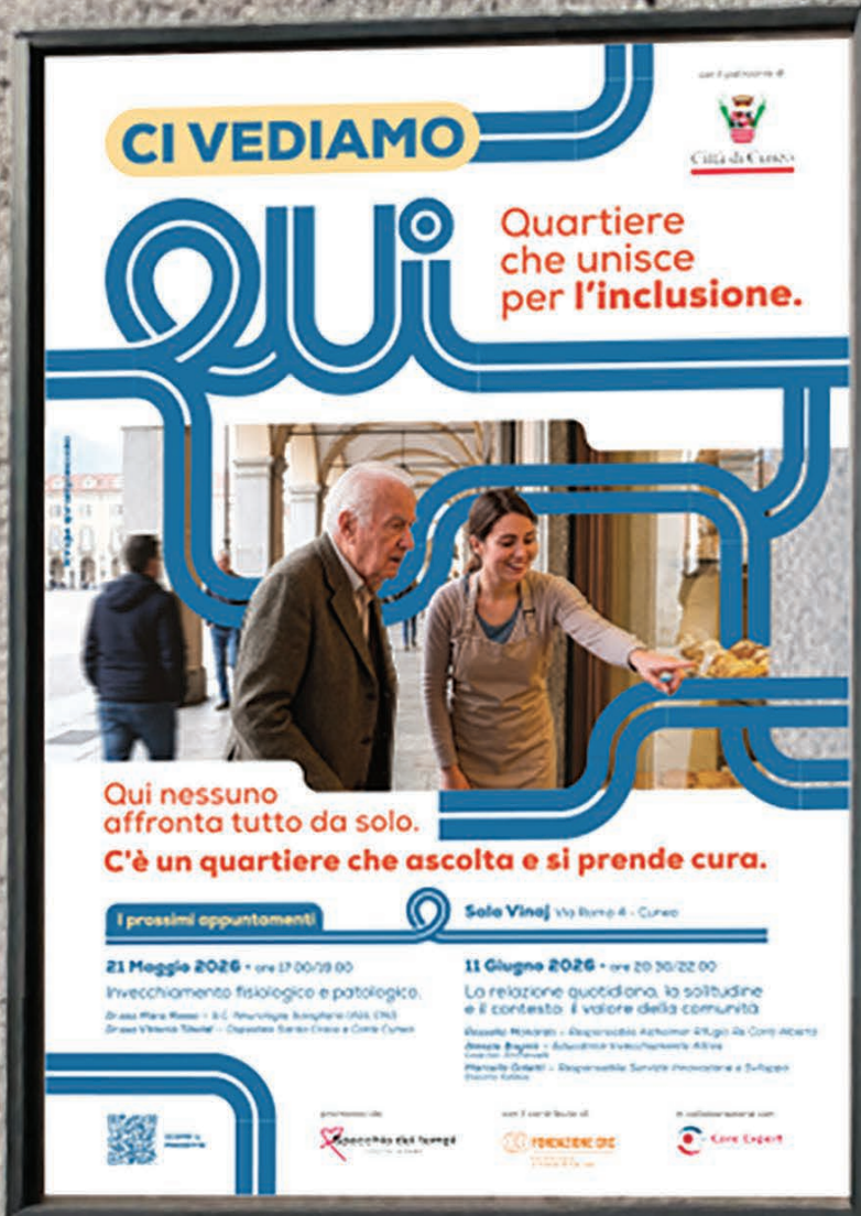
Immagine a puro scopo evocativo